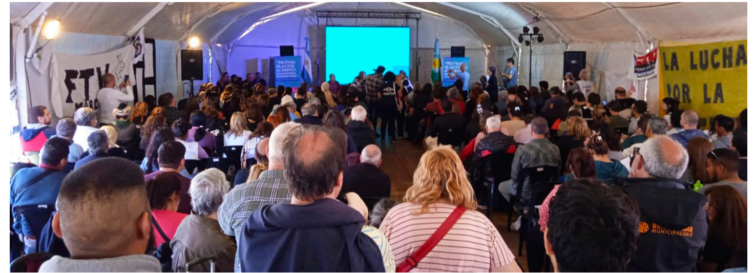
21. Participación junto con referentes de la Mesa de Urbanización barrial en las jornadas de debate por los 10 años de la Ley 14.449 (Ley de Acceso Justo al Hábitat)