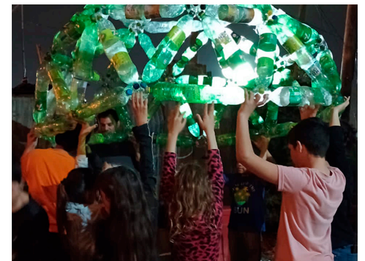
23. Jornadas del taller de enseñanza para niñeces, "Haciendo Escuela"