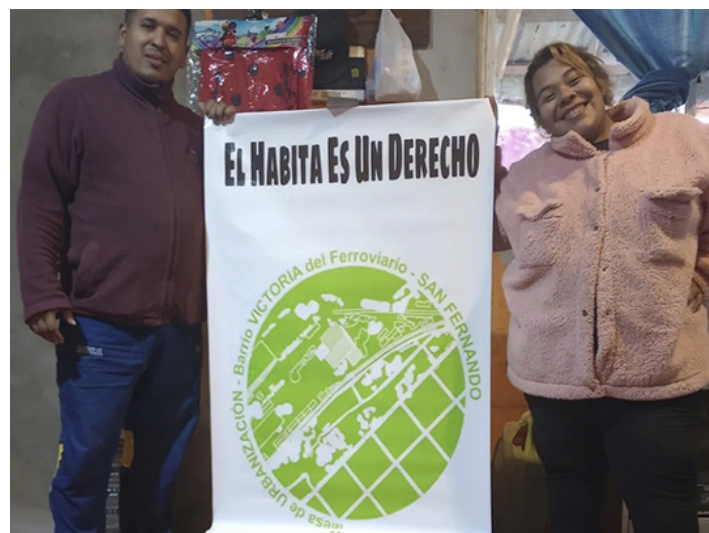
4. El Hábitat es un derecho, acciones para la visibilización del barrio.