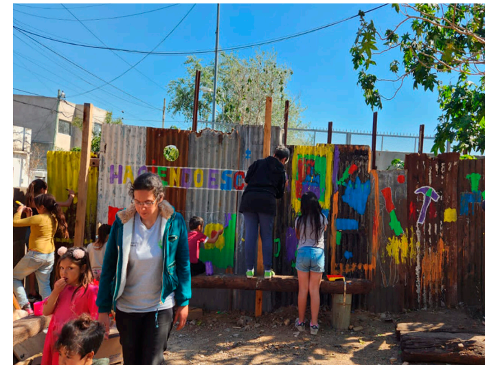
22. Jornadas del taller de enseñanza para niñeces, "Haciendo Escuela"