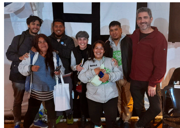
20. Participación junto con referentes de la Mesa de Urbanización barrial en las jornadas de debate por los 10 años de la Ley 14.449 (Ley de Acceso Justo al Hábitat)

Se considera un aprendizaje de estas experiencias el trabajo en las mesas de participación interactoral en las distintas escalas: barrial, local, provincial. Un ejemplo de ello es la mesa de urbanización del Barrio La Victoria, la cual continúa su proyecto y escala su acción en todo el municipio, con la expectativa de avanzar en una transformación urbana que aproxime a los pobladores de todos los barrios populares de San Fernando al derecho a la ciudad. También asiste al Consejo Provincial de Hábitat, el cual ha sido un espacio para la visibilización de las problemáticas, defensa de los derechos, y gestión de políticas públicas que atiendan las demandas de las mesas locales y barriales.