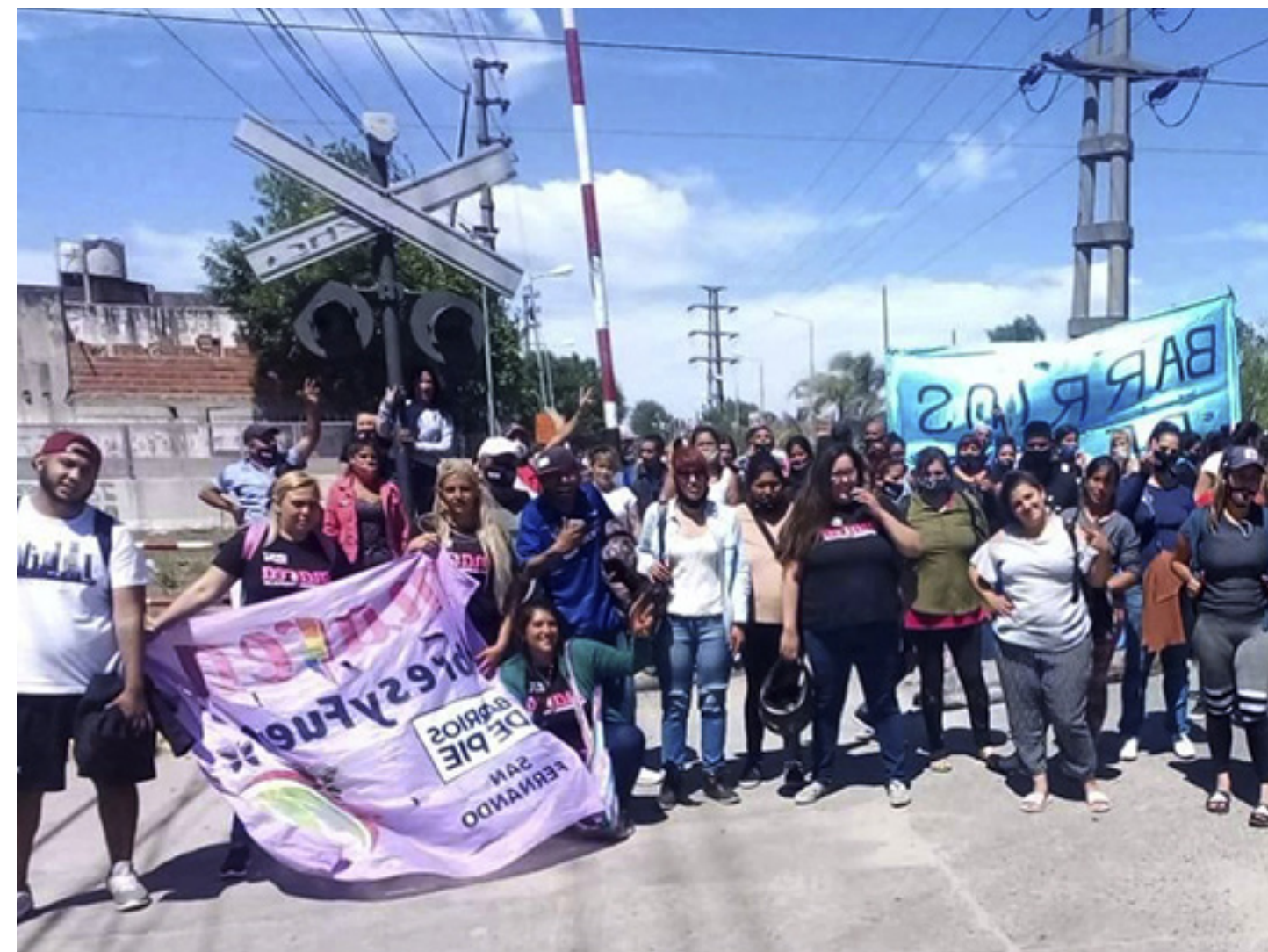
5. Movilización por un hábitat digno en San Fernando.