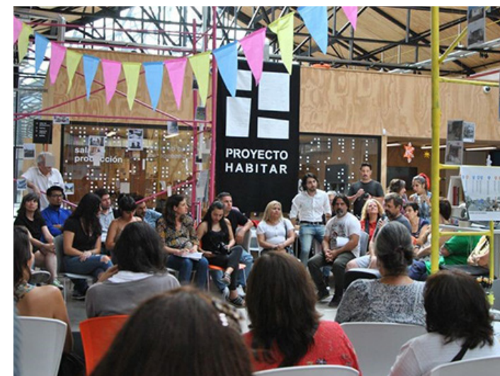
18. Encuentro de fin de año junto a referentes de la lucha por el derecho a la ciudad y al hábitat, Ciudad Autónoma de Buenos Aires.