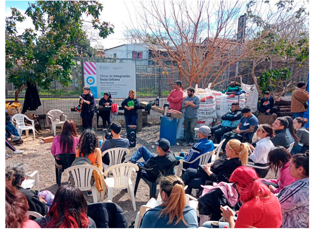
12. Asambleas de la Mesa de Urbanización barrial.

I also manage with the urbanization roundtable improvements to different public organizations, such as the granting of 50 housing improvements with funds from Law 14449 on Fair Access to Habitat, and the improvement of intralot electricity and water infrastructure, within the framework of the policies of the Secretary of Socio-Urban Integration of the Nation. In both cases, we sought to strengthen the capabilities of its inhabitants, forming work groups made up of residents of the neighborhood.