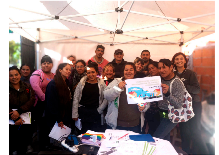
9. Talleres de Hábitat Saludable en el arco del Programa de Mejoramientos Habitacionales financiados por SELAVIP.