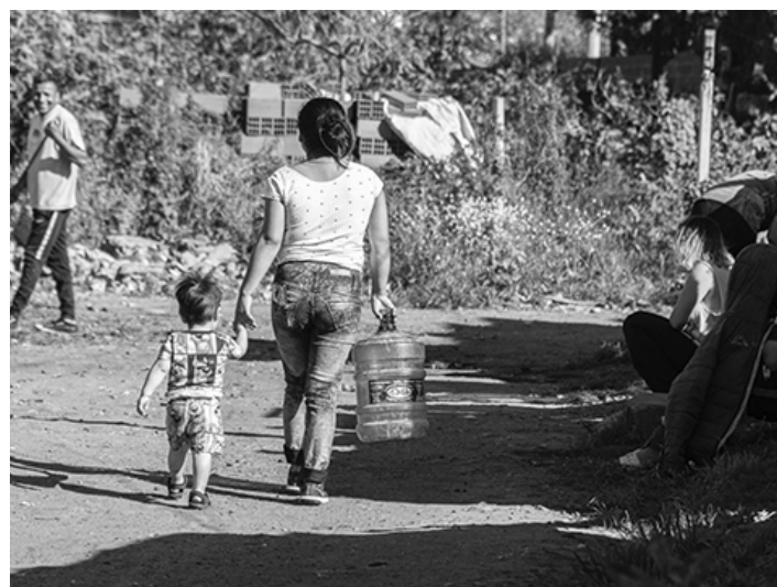
3. Acciones cotidianas para el acceso al agua potable