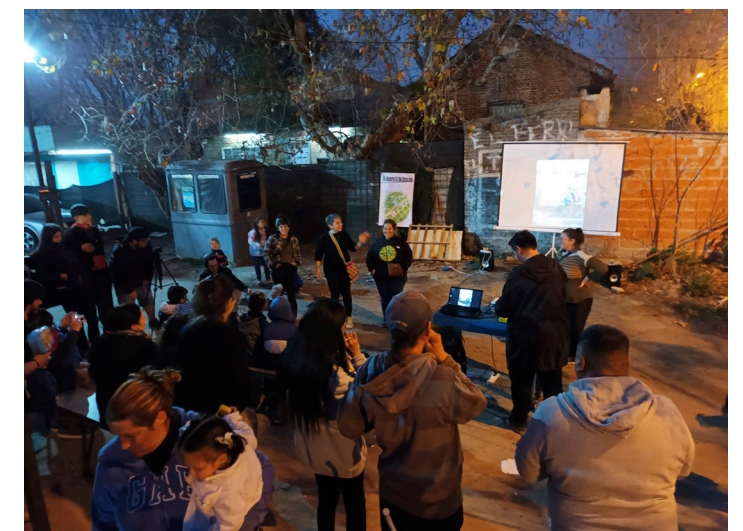
25. Presentación del documental "Habitar"