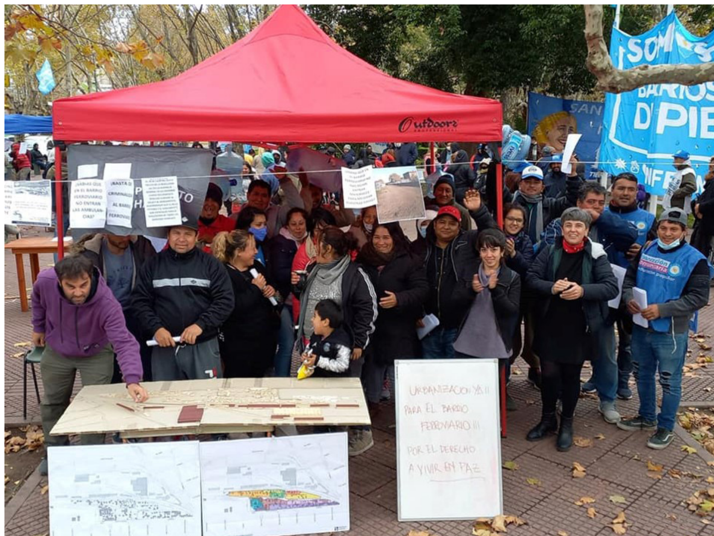
2. Manifestación frente al edificio de la municipalidad de San Fernando en lucha por el acceso al agua y a un hábitat digno.