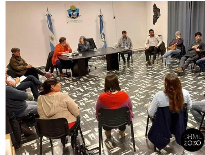
14. Consejo Asesor de Planificación, Chos Malal, Neuquen.

Each of the actions carried out by PH address issues of public interest that need to be recovered at all levels of dialogue and encounter. Another example is the Habitat Primary Care Clinics (4), where meetings are held with each of the families for the production of the housing and neighborhood project. In public spaces, such as institutional spaces created by regulations like the Habitat Council of Law 14449, as well as in the creation of meetings that allow sharing experiences, struggles and achievements mobilized by the right to the city.