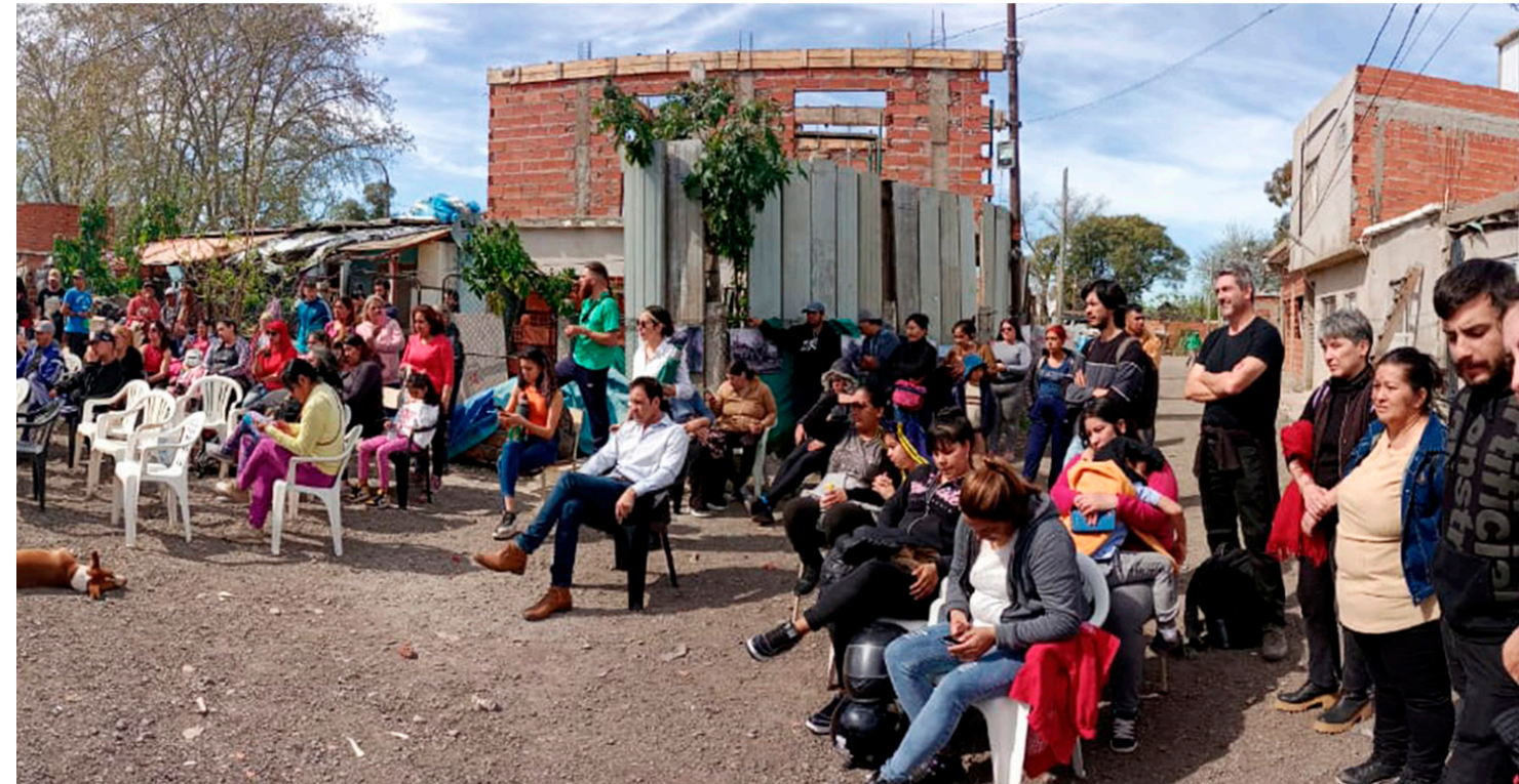
11. Asambleas de la Mesa de Urbanización barrial.

También gestiona con la mesa de urbanización mejoras a distintos organismos públicos, como el otorgamiento de 50 mejoramientos habitacionales con fondos de la Ley 14449 de Acceso Justo al Hábitat, y el mejoramiento de las infraestructuras de electricidad y agua intralotes, en el marco de las políticas de la Secretaría de Integración socio urbana de Nación. En ambos casos se buscó fortalecer las capacidades de sus habitantes, conformando cuadrillas de trabajo integradas por vecinos y vecinas del barrio.