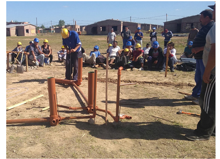
15. Capacitaciones a trabajadores de la economía popular en Escobar, Pcia de Buenos Aires