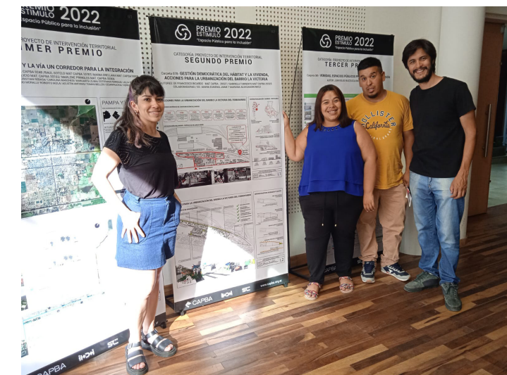
7. Exposición de trabajos premiados en "Premio Estímulo CAPBA 2022" categoría de Proyecto de Intervención Territorial.