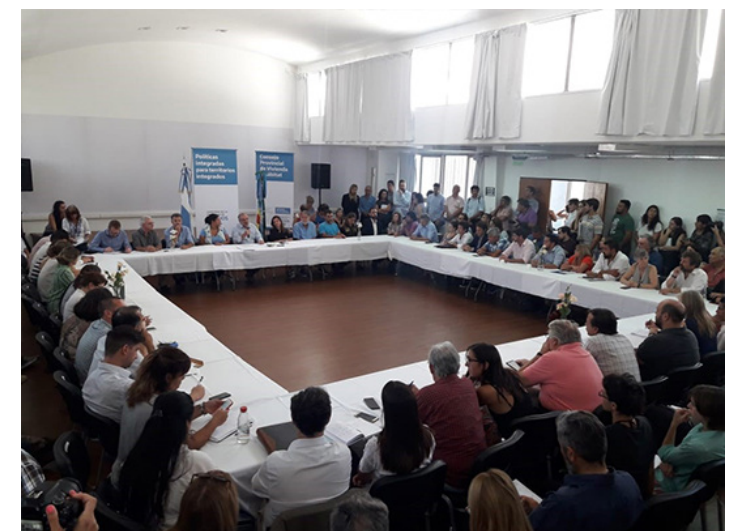
19. Consejo provincial por el Acceso justo al Hábitat, Bs. As.