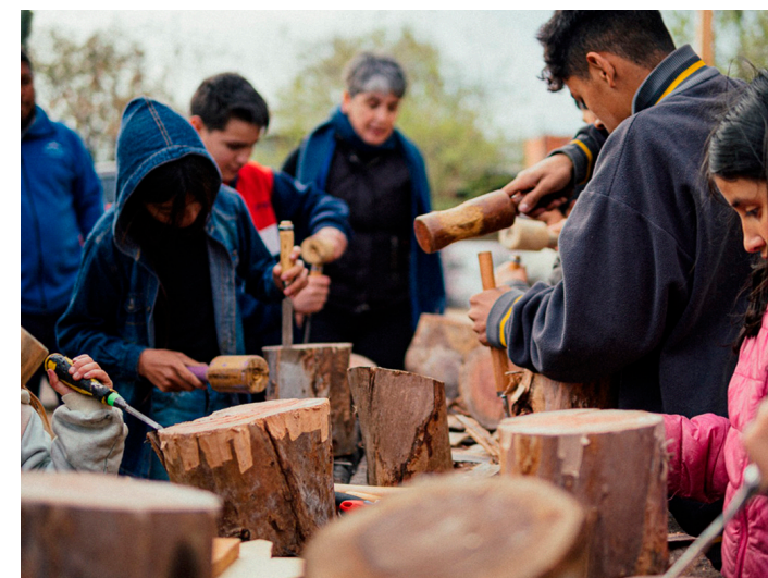
24. Jornadas del taller de enseñanza para niñeces, "Haciendo Escuela"