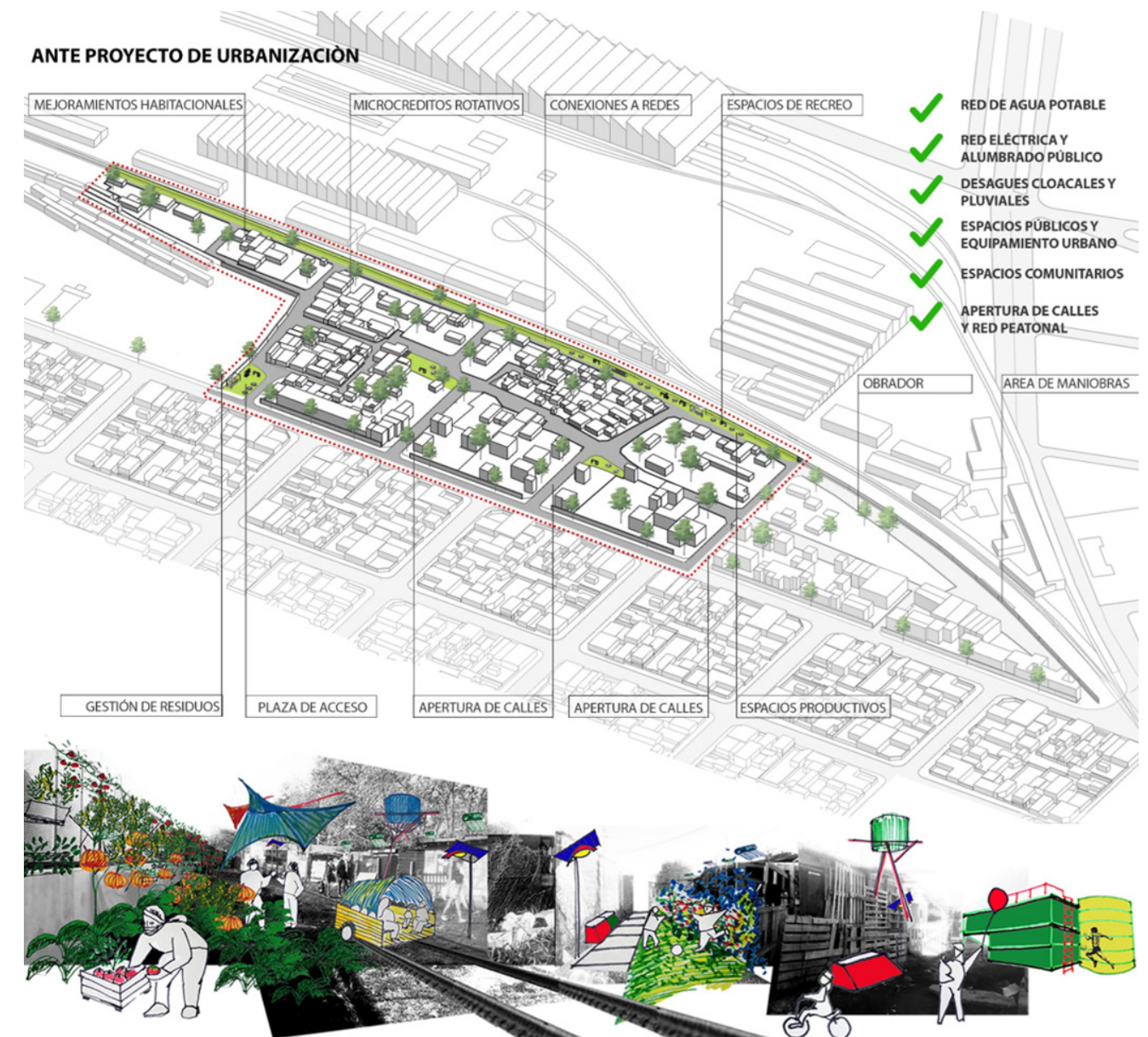
10. Anteproyecto de urbanización para el Barrio La Victoria realizado por Proyecto Habitar y la Mesa de Urbanización