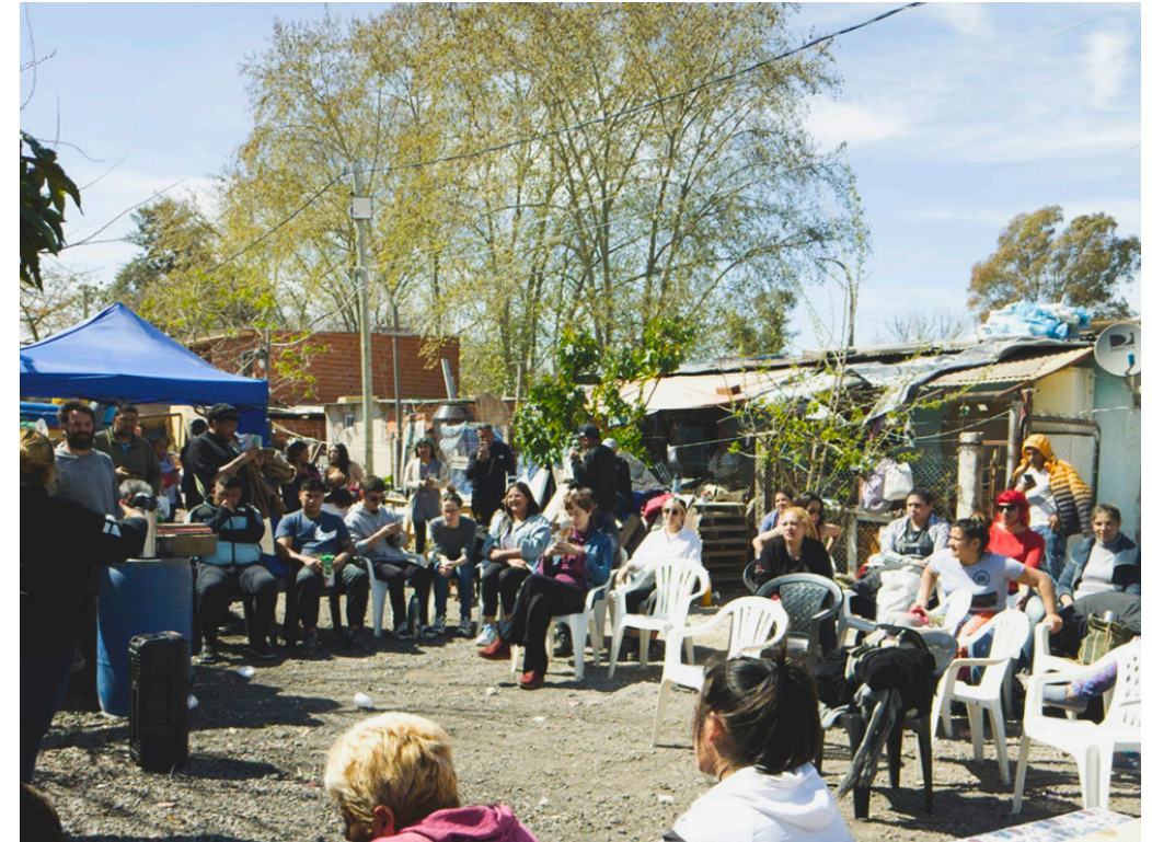
13. Asambleas de la Mesa de Urbanización barrial.