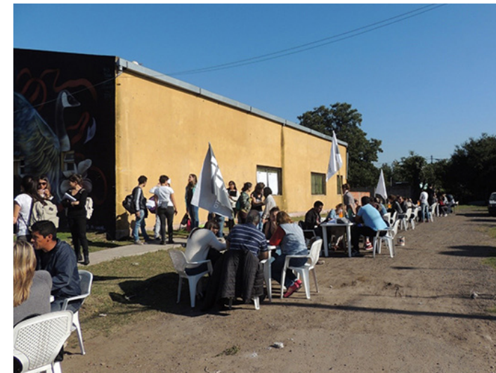
16. Consultorios de Atención Primaria de Hábitat en Barrio Los Milagros, Hurlingham, Buenos Aires.