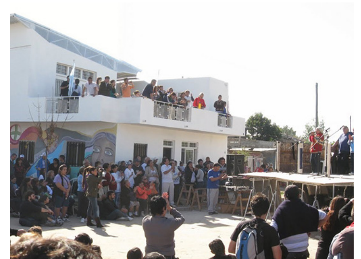
17. Fiesta de inauguración de obra de ampliación de la sala de salud Doctor Chino Oliveri, barrio M. Elena, La Matanza, Bs. As.