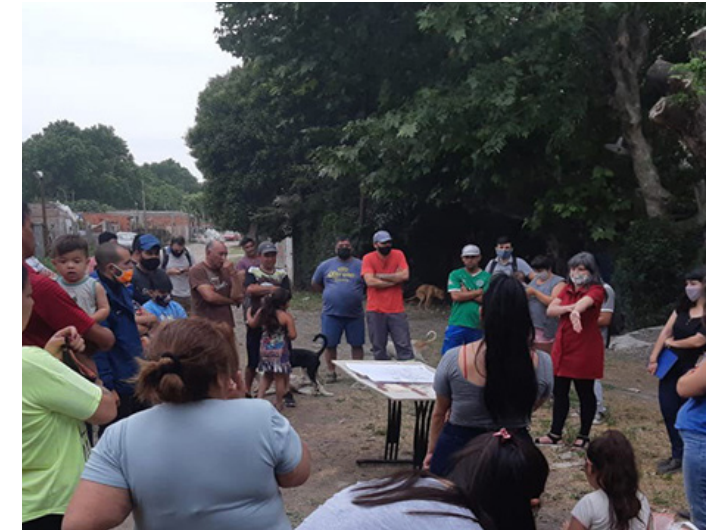
8. Mesa por la urbanización del barrio.

Together with the lawyers, requests were made to access public information that would clarify the conditions of the judicial case and end the harassment by the authorities.