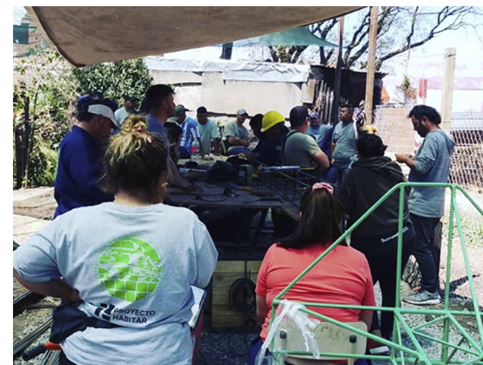
6. Asamblea para la organización de los mejoramientos habitacionales